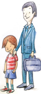
Defensor de Menores

También estudia, investiga y toma decisiones importantes.