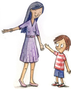
La trabajadora Social

SEGURAMENTE PRESTASTE MUCHA ATENCIÓN A ESTE LIBRO Y TE SERÁ MUY FÁCIL RECONOCER QUIEN SE OCUPA DE CADA TAREA EN UN JUZGADO... VAMOS A UNIR CON FLECHAS! SI TENÉS DUDAS PODÉS BUSCAR LAS RESPUESTAS RELEYENDO LAS PÁGINAS ANTERIORES.